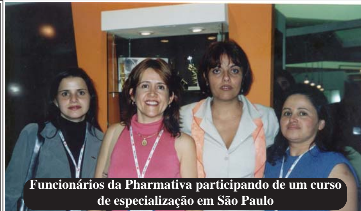
Funcionárias da Pharmativa participando de um curso de especialização em São Paulo

Rua Aristides Francisco Pinto, 800 Santa Matilde